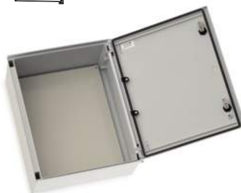
06BRES64 Caixa porta opaca 06BRES64